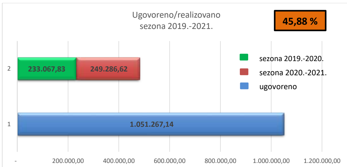
Slika 10.2. Ugovoreno realizovano 2019.-2021.