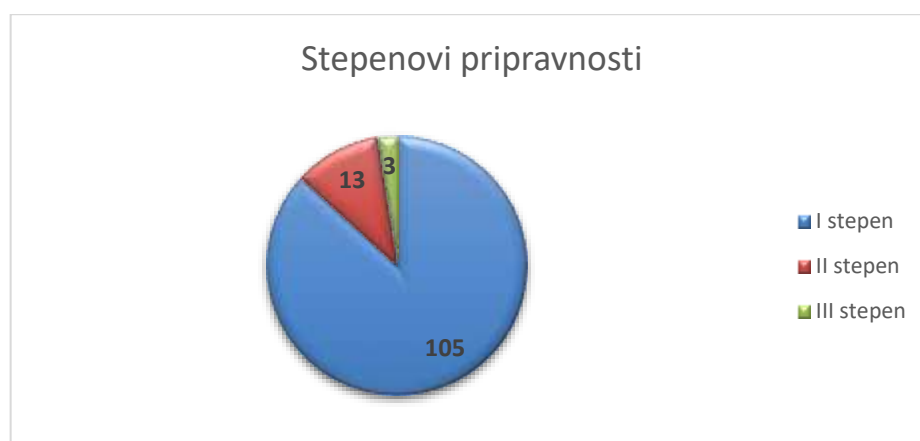
Slika 9.1. Stepenovni pripravnosti